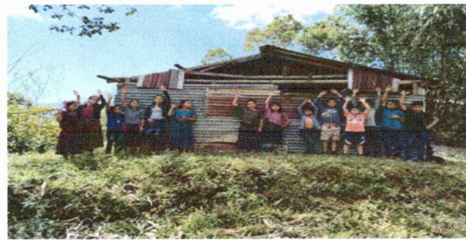
Foto 3: En esta foto se obseva el dereritorio de las laminas de una cocina