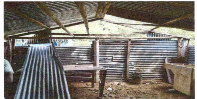
Foto 4: En esta fotografia se observa el dereritorio de las costaneras de una cocina