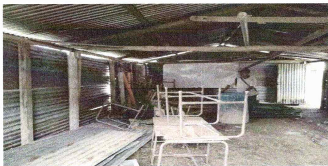
Foto 5: En esta imagen se observa el deterioro del piso de una cocina