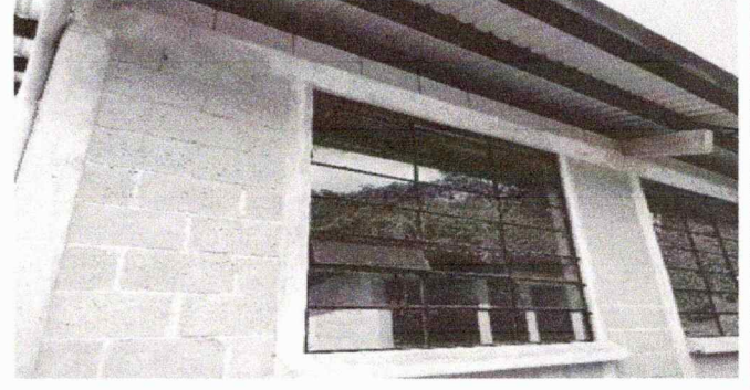
Foto 2: En esta fotogaria se observa el dereritorio de la pintura de 1 modulo de 1 salon . .