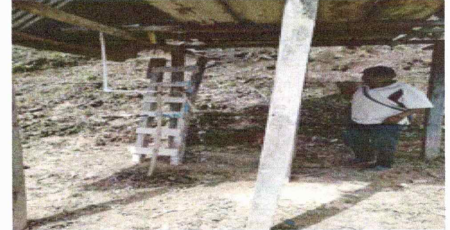
Foto 6: En esta fotografia se observa el deterioro de las columnas del lugar de un tinaco.

Observación: Si es necesario se pueden agregar hojas adicionales y actualizar el número de hojas.